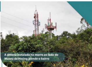
A antena instalada no morro ao lado do Museu da Hering atende o bairro