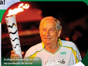
A alegria tomou conta dele na condução da tocha

Mecânico de manutenção, por lá ficou durante 13 anos. Muitos deles sem finais de semana. Não tinha tempo ruim pra ele. E não penssem que o rio Itajaí ficou longe dele. Seu maior desafio foi nos anos de 83 e 84, nas grandes enchentes. Praticamente morou lá nesses dois períodos.