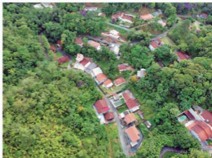
Ocupação de encosta de morro à direita preocupa moradores da Augusto Otte