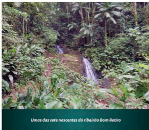
Umás das sete nascentes do ribeirão Bom Retiro